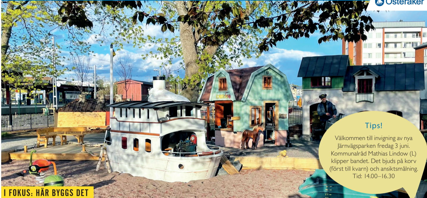
I FOKUS: HÄR BYGGS DET