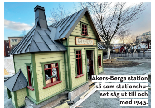
Åkers-Berga station så som stationshuset såg ut till och med 1943.