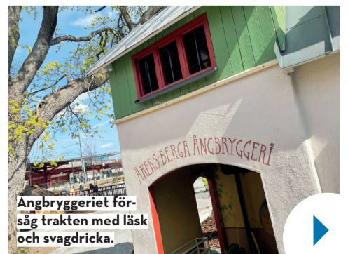
Ångbryggeriet för-såg trakten med läsk och svagdricka.