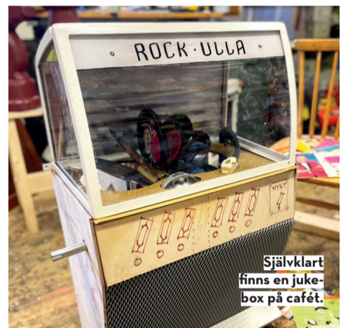
Självklart finns en jukebox på kaféet.