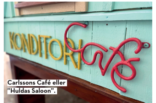
Carlssons Café eller "Huldassaloon".