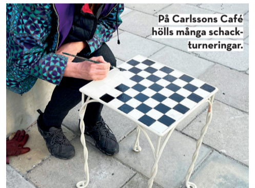
På Carlssons Café hölls många schackturneringar.