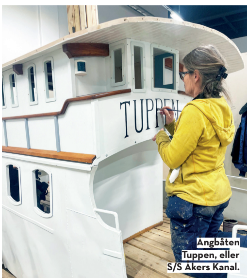
Ångbåten Tuppen, eller S/S Åkers Kanal.

Ett torp och en lada med vällingklocka, ladugårdsdjur och tidstypisk traktor.